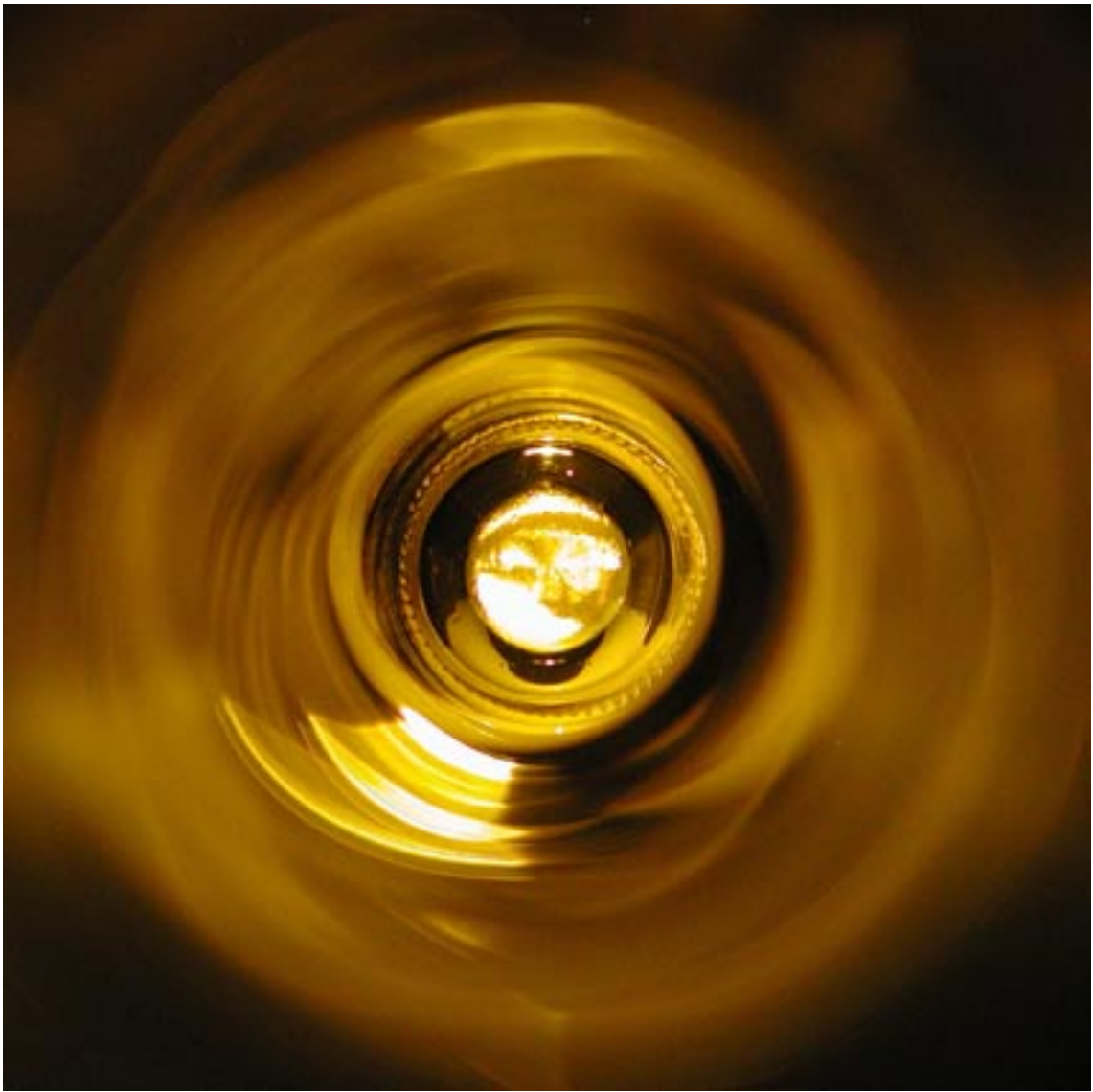
Réf.311 Bec à Miel